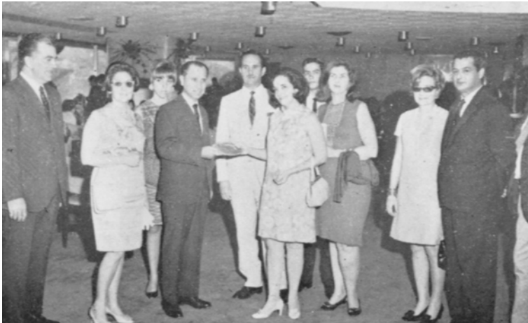
Entrega trofeo del Primer Congreso Venezolano de Dermatología Hipódromo La Rinconada